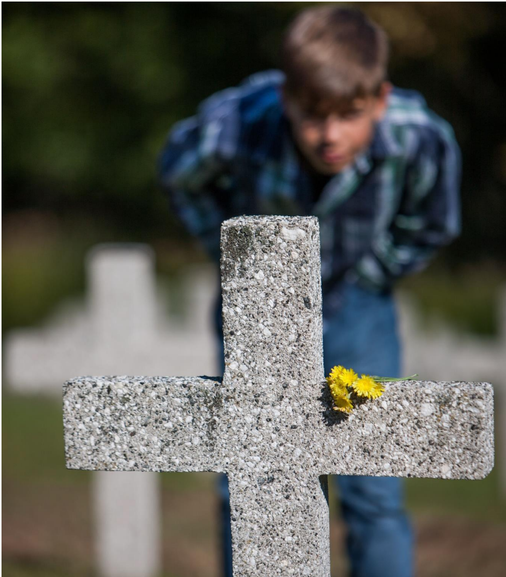
Nécropole HWK